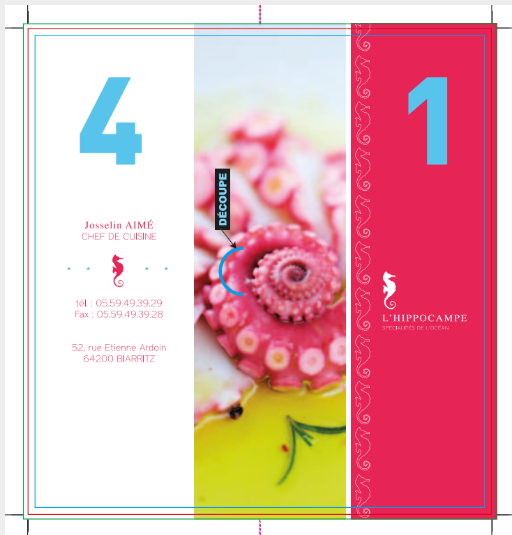
Fichier dans gabarit